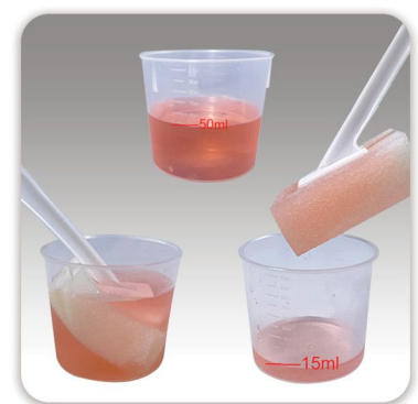
قابلیت جذب بالا